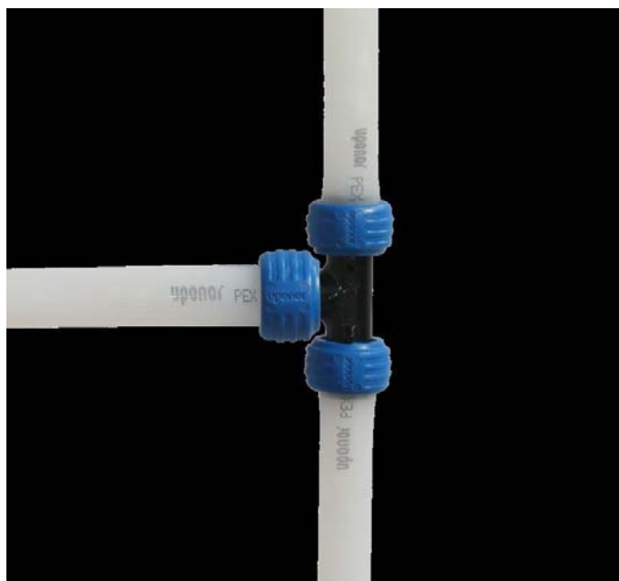
Figure 3 - Assemblages tube/raccord QUICK & EASY

Les dimensions des bagues sont adaptées pour un assemblage rapide, efficace, durable et de qualité de la jonction entre le tube et son raccord.