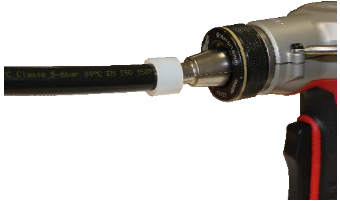
Figure 4 - Réalisation des assemblages

L'utilisation de la pince électroportative est décrite dans la notice de l'appareil. Elle simplifie la séquence d'expansion du tube avec sa bague.