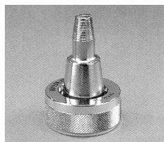
Figure 1 - Pince d'expansion Figure 2 - Tête d'expansion

L'assemblage comporte les composants suivants (voir figure 3) :