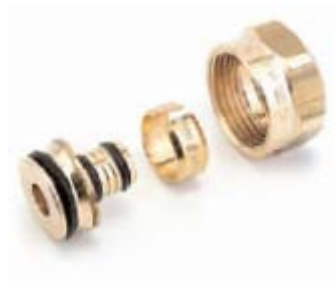
Figure 1 - Photo et schéma de principe des raccords à compression SAR 829/839 de COMAP