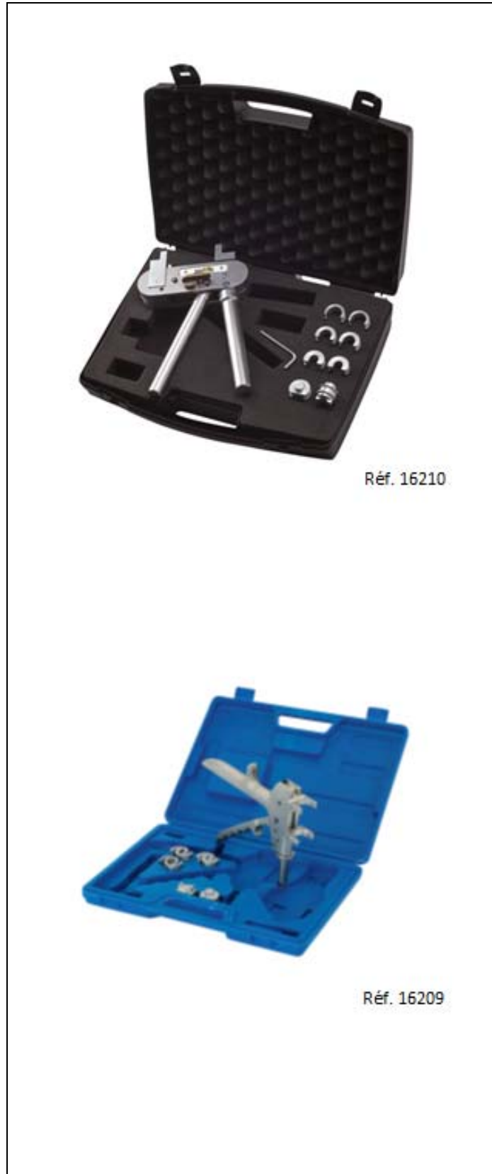
Figure 3 – Outillage d'assemblage