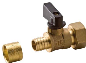
Figure 1 – Vanne à glissement RIQUIER