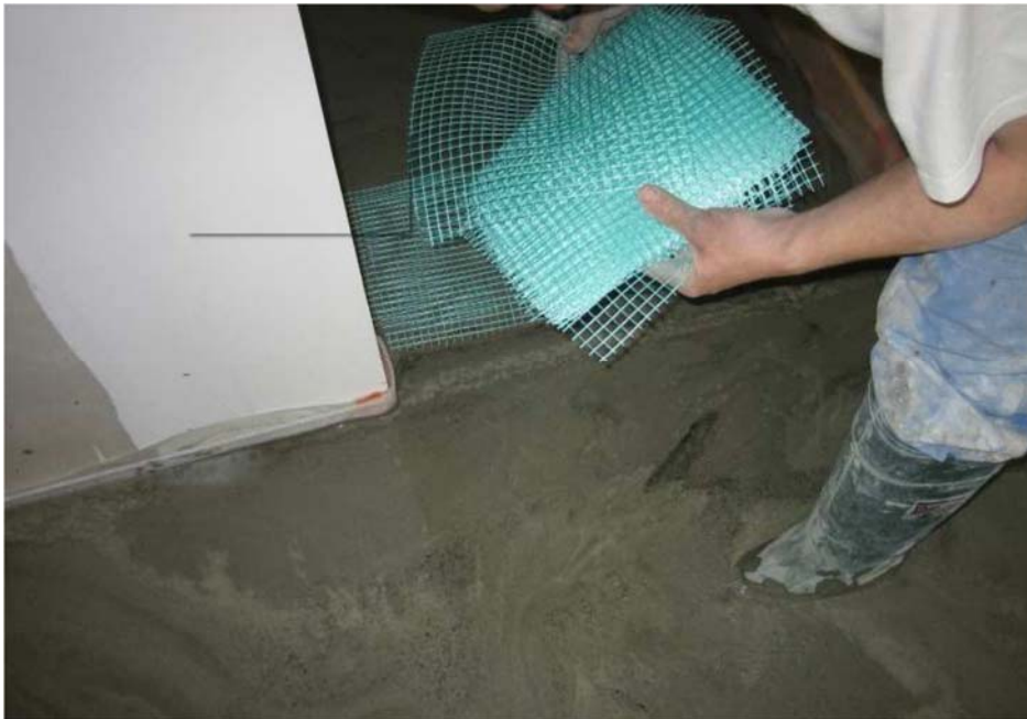
Figure 1 - Disposition des renforts