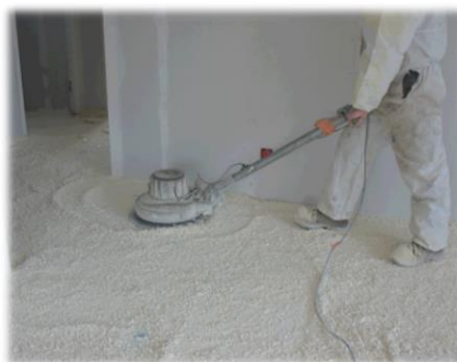
Figure 4 : Ponçage

La surface isolée, devra être balayée ou aspirée afin d'éliminer les déchets de ponçage.