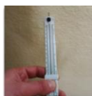
Figure 5 : contrôle de l'épaisseur

L'épaisseur projetée est la moyenne des mesures, arrondie à 5 mm par défaut. Cette épaisseur est retenue pour déterminer la résistance thermique.