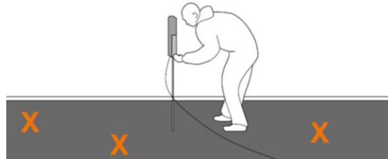
Figure 2 : Vérification de l'horizontalité finale

L'opération de contrôle et de projection décrite dans le paragraphe 8.2.2 du CPT 3820 de février 2022 est réalisée.