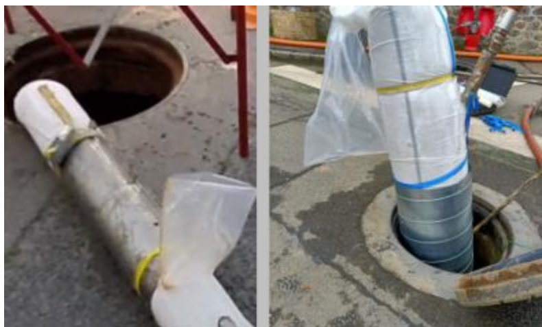
Figure 3 : Modèles de contre-moule pouvant être utilisés pour récupérer un échantillon en extrémité, au diamètre de la canalisation