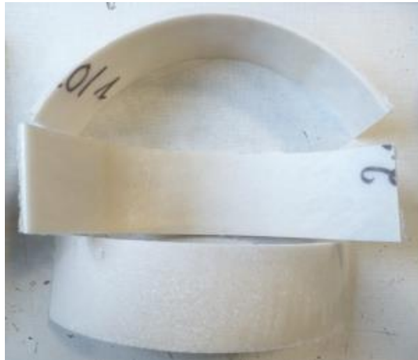
Figure 5 – Photo d'aspect du chemisage polymérisé BREIZH LINER