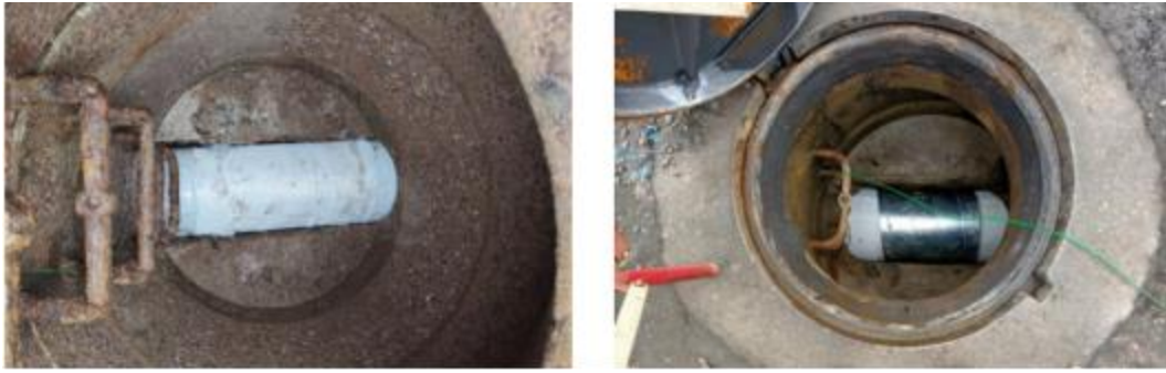
Figure 4 : Modèles de contre-moule pouvant être utilisés pour récupérer un échantillon en regard intermédiaire, au diamètre de la canalisation