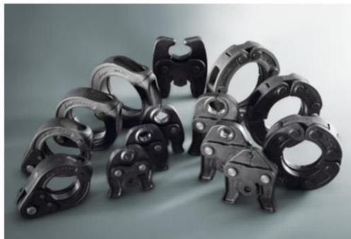
Figure 1 – Mâchoires et anneaux de sertissage Viega

Les mâchoires et les anneaux de sertissage marqués « VIEGA » sont préconisés. Les mâchoires et les anneaux de sertissage comportent également l'indication du diamètre. (Figure 1)