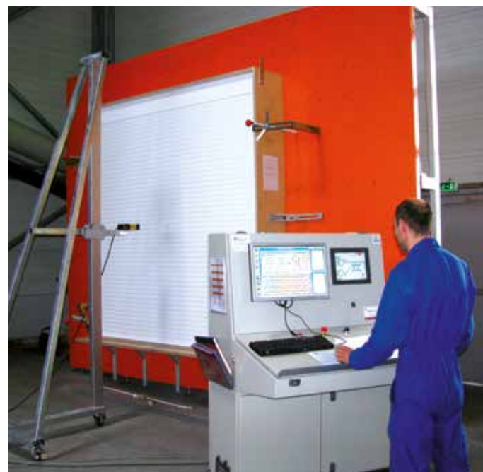
Banc d'essai de résistance au vent

Pour s'informer sur les produits certifiés : http://evaluation.cstb.fr