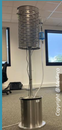
Portair installé dans chaque bureau intégrant tous les dispositifs de mesure

Mesures en continu pendant 5 jours de la qualité de l'air intérieur et du confort thermique au moyen d'appareils peu encombrants, silencieux et la plupart autonomes en énergie