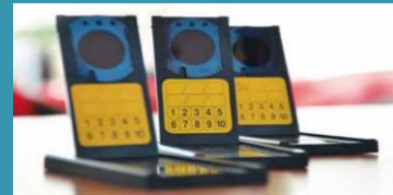
Détecteur radon exposé dans chaque pièce pendant 2 mois