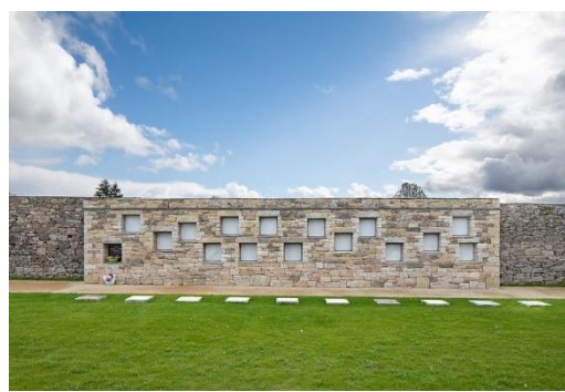
Jardin du souvenir Plourin-Lès-Morlaix (29)