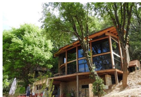
Villa Orion Saint-Paul-de-Vence (06)