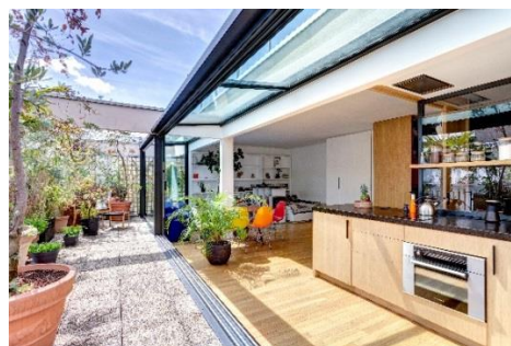
Rénovation et extension d'un studio en open space Paris (75) ©Renaud Djian Architecte 2019