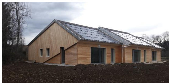
Le Pré Colas – 12 logements locatifs groupés pour personnes âgées et à mobilité réduite Saint-Lupicin (39)