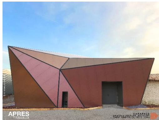
La Carapace Saint-Martin-du-Bois (33)