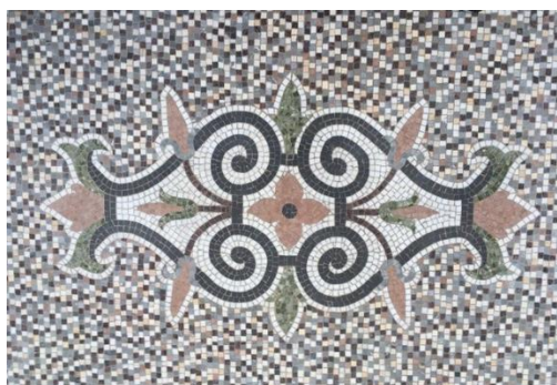
Jardin d'hiver Fumay (08)