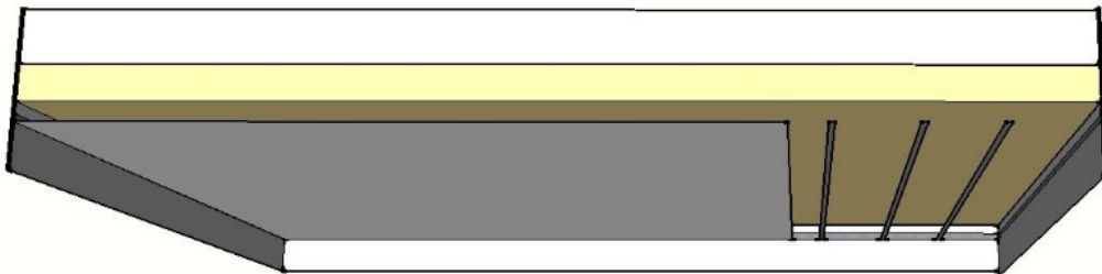
Figure 3 : Plafond constitué de montants simples ou doubles sans dispositif de suspension au support

Les rails peuvent être mis en œuvre avant ou après la projection de l'isolant. S'ils sont mis en œuvre avant la projection, l'isolant est projeté de sorte à venir mourir sur le nu supérieur du rail pour permettre la mise en œuvre des montants et une pose ultérieure des plaques de plâtre (cf figure 3).