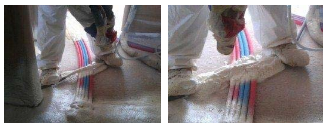
Projection sur les croisements de gaines

L'applicateur débute la projection sur les zones de croisements des canalisations. Pour remplir l'espace créé par leur chevauchement, le mouvement du bras de l'applicateur lors de la projection doit suivre le sens du conduit supérieur et doit être réalisé de chaque côté de celui-ci. Cette opération peut être répétée jusqu'à la suppression totale de tout vide dans ces zones après expansion de la mousse ( photos ci-dessous ).