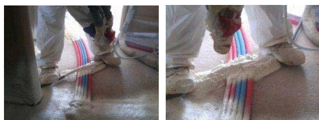
Projection sur les croisements de gaines

L'applicateur débute la projection sur les zones de croisements des canalisations. Pour remplir l'espace créé par leur chevauchement, le mouvement du bras de l'applicateur lors de la projection doit suivre le sens du conduit supérieur et doit être réalisé de chaque côté de celui-ci. Cette opération peut être répétée jusqu'à la suppression totale de tout vide dans ces zones après expansion de la mousse (photos ci-dessous).