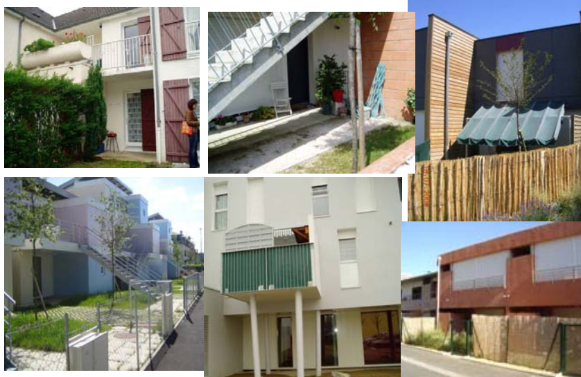
Exemples d'espaces extérieurs choisis dans différents sites, posant des problèmes de configuration et entravant la capacité d'intimisation de cet espace

autre partie du jardin ou aller vers leur espace avant. Nous avons ainsi distingué entre les espaces et les lieux qui permettent la rencontre fortuite (partie plus visible du jardin ou de la terrasse, garages, boîtes aux lettres, lieux des containers à ordures, cheminements, aire de jeux, etc.) et ceux qui permettent des relations souhaitées, organisées par les personnes elles mêmes. Les sites où l'on observe les