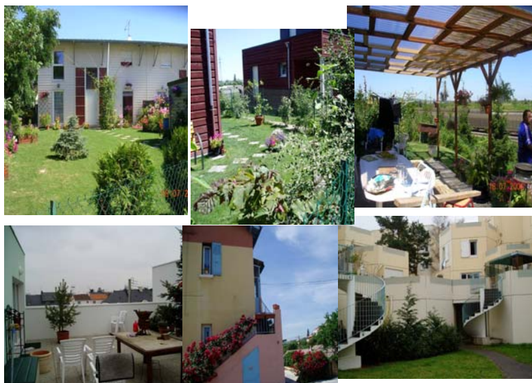
Supports de développement d'usages et d'individuation dans différents sites

Contre toute attente, la question du caractère « individuel », ou réellement individuel (libre de murs) de l'habitat n'est pratiquement pas apparu dans les entretiens. Au contraire même, dans les situations les plus favorables, pouvoir concilier une dimension collective au sens d'un lieu support d'interactions et un « chez soi » enrichi de nouveaux espaces, de nouveaux dispositifs, est apparu comme la qualité fondamentale de ce type d'habitat. Il se pourrait alors