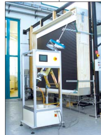
> Banc d'endurance mécanique

↓ Déclaration de Conformité CE par le fabricant