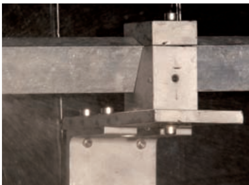
Étanchéité à l'eau