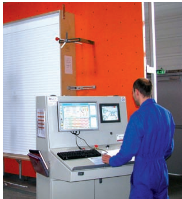
Banc d'essai de résistance au vent

*V 3 E 2 MCROS 1 * XXX-YZ ΔR = 0,15 ΔR = 0,20 alu PVC