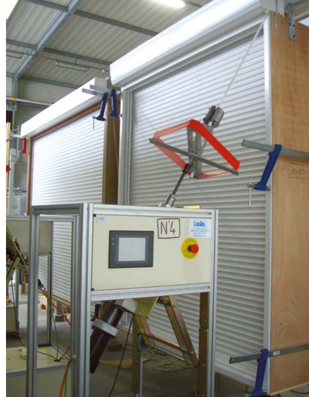
Banc d'endurance mécanique : les volets sont soumis à des cycles de repliement-dépliage (7 000, 10 000 ou 14 000) équivalents à plusieurs années d'utilisation.